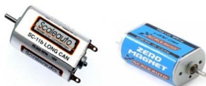
Motores homologados: Motor Scaleauto SC-11B Motor SC-31 Zero Magnet (Copa GT2)

Los motores serán entregados por la organización mediante sorteo. Una vez finalizada la prueba los equipos devolverán a la Coordinadora dichos motores para poder ser utilizados en las siguientes carreras. El campeonato se iniciará con motores nuevos y estos se rotarán las primeras pruebas hasta haberlos utilizado al menos una vez.